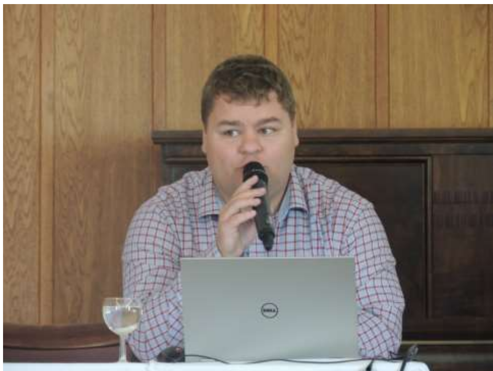
Prezentace dobré praxe Osoblažského cechu z.ú. (Moravskoslezský kraj)